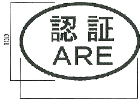
L型擁壁及び補強土擁壁